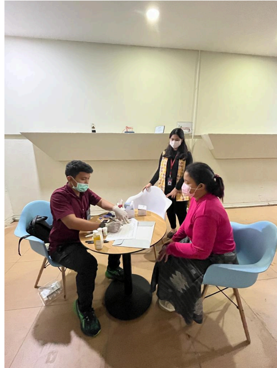
Hasil pemeriksaan darah Tenaga Kerja Indonesia WNI/PMI Shelter