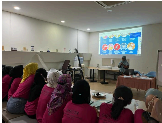
Gambar 1. pemberian pelatihan kepada Tenaga kerja Indonesia di Malaysia

Pelatihan dimaksud agar partisipan yang hadir dalam pengabdian dapat menjadi kader kesehatan bagi tenaga kerja wanita lainnya. Tenaga kerja diajarkan agar mandiri dan sadar menjaga kesehatan mulai dari diri sendiri lalu tenaga kerja.