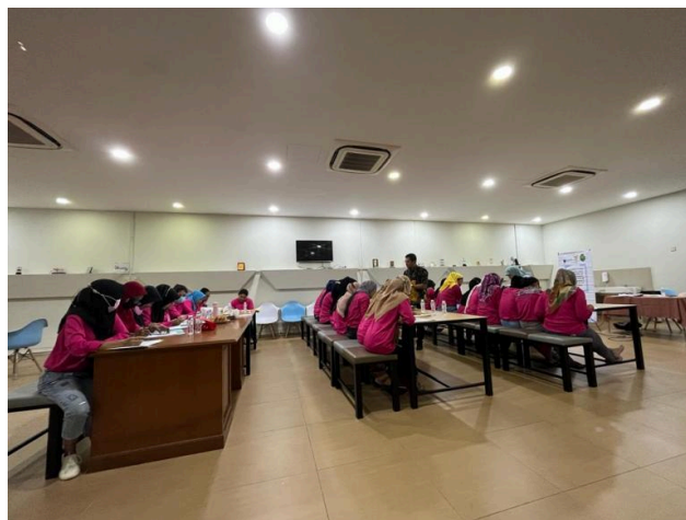
Gambar 2. Pengisian kuesioner pre-test

Sebelum diadakan penyuluhan dan pelatihan maka diberikan kuesioner untuk melakukan Pre- test terlebih dahulu. Setelah kegiatan selesai tenaga kerja Indonesia dibagikan kuesioner kembali untuk melakukan Post-Test, kegiatan ini untuk mengukur tingkat pengetahuan, sikap, dan perilaku yang dijalankan selama ini oleh tenaga kerja.