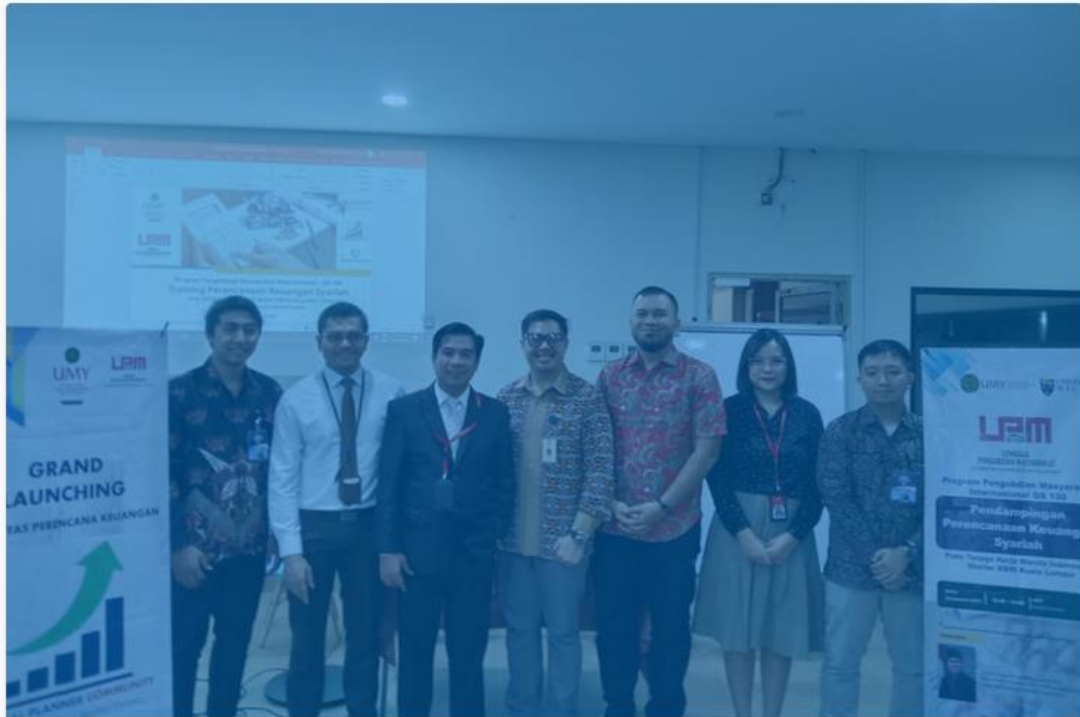
Dosen UMY beserta pejabat embassy KBRI Kuala Lumpur berfoto bersama usai kegiatan.